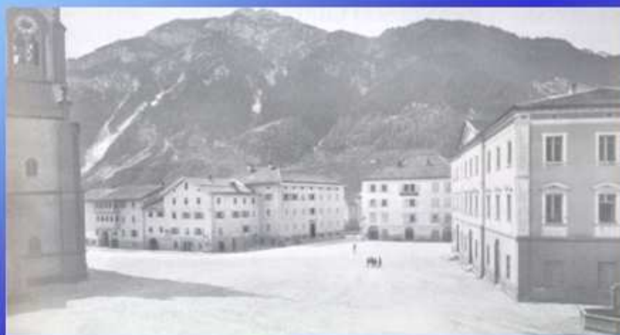
... e a Predazzo (Trento) per i figli degli operai (1951-54), attrezzata per 170 persone