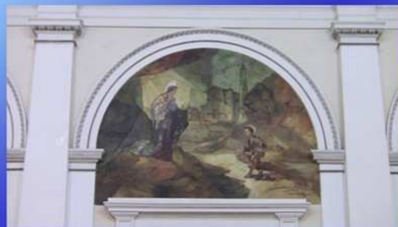
Dota la chiesa degli affreschi sulla vita di S. Pio X (1955-56): La