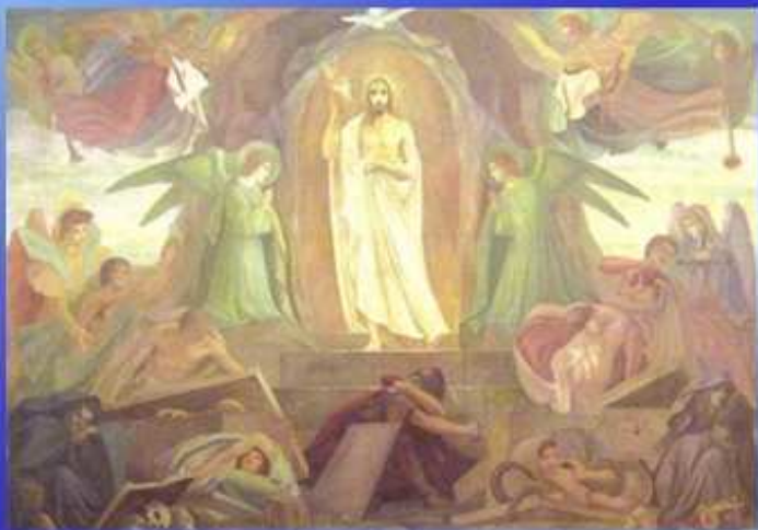
La resurrezione di Gesù (A. Monzio Compagnoni 1954)