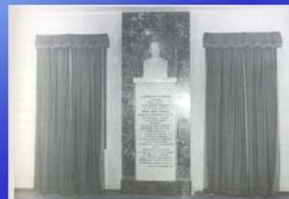
Monumento eretto a ricordo delle sue opere (1959) La sua opera non è stata unanimemente riconosciuta