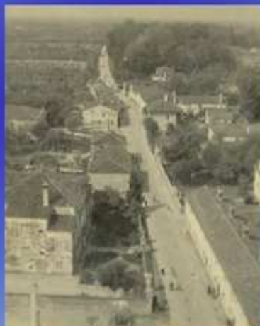
La strada principale di Salzano vista dal campanile

A Salzano diventa parroco nel Dopoguerra, tra il 1949 ed il 1958, in un periodo di profondo cambiamento per il paese, da una società di tipo rurale ad una società di tipo industriale