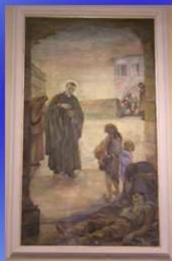
Don Giuseppe Sarto e i colorosi

Vuole che siano dipinti quattro affreschi sul parroco Sarto, nuovo santo