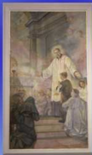
Don Giuseppe Sarto e l'Eucarestia