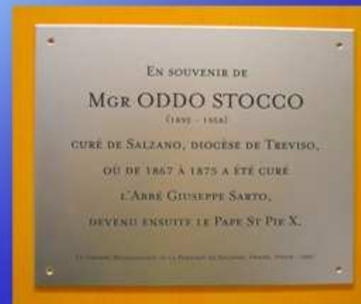
9 dicembre 2007 è inaugurato l'Orfanotrofio St Vincent di Niamey (Niger), con sale e dormitori intitolati a mons. Stocco