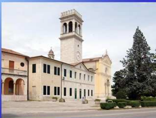
San Zenone degli Ezzelini (1931-49)