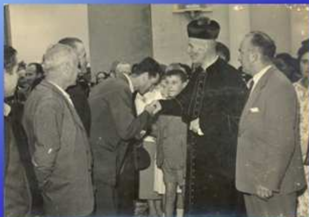
Mons. Stocco nell'ultimo anno di vita, visibilmente deperito a causa della malattia (1957)