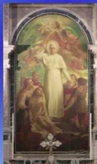
Pala del Beato Pio X (1951) di A. Monzio Compagnoni