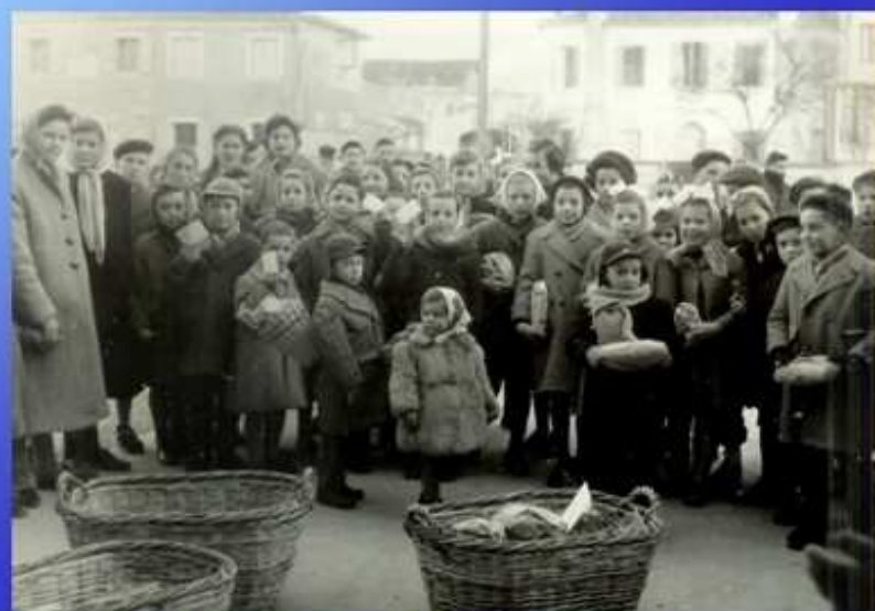
Prima Giornata della carità (1954)