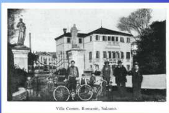
Villa Comm. Romanin, Salzano.