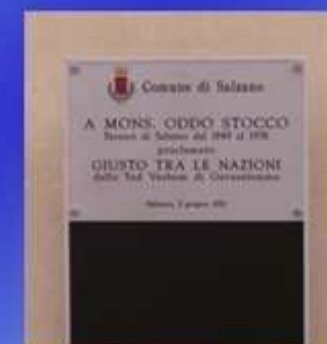
E' riconosciuto "Giusto tra le nazioni" (2010)