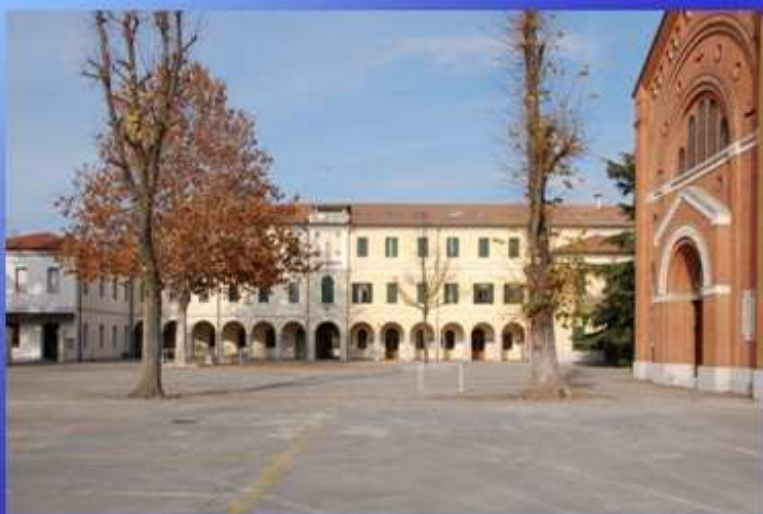
Collegio Salesiano "Omobono Astori" - Mogliano Veneto