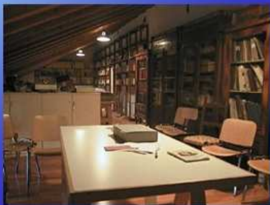
La sua biblioteca conservata nell'Archivio Storico Parrocchiale "G. Furlanetto" di Salzano