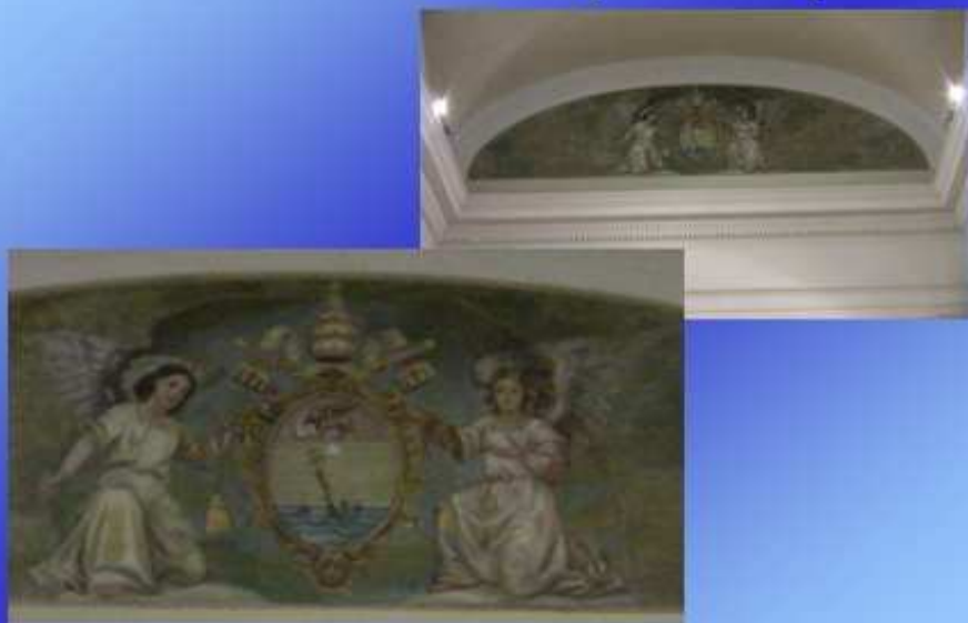
Tra il 1951 ed il 1954 gestisce la glorificazione di Pio X