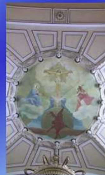
La Trinità e la Sacra Famiglia (A. Monzio Compagnoni 1954)