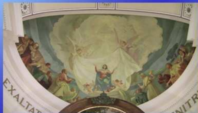
Assunzione di Maria in cielo (A. Monzio Compagnoni 1954)