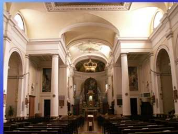
L'interno della chiesa dopo i restauri del 2004-05