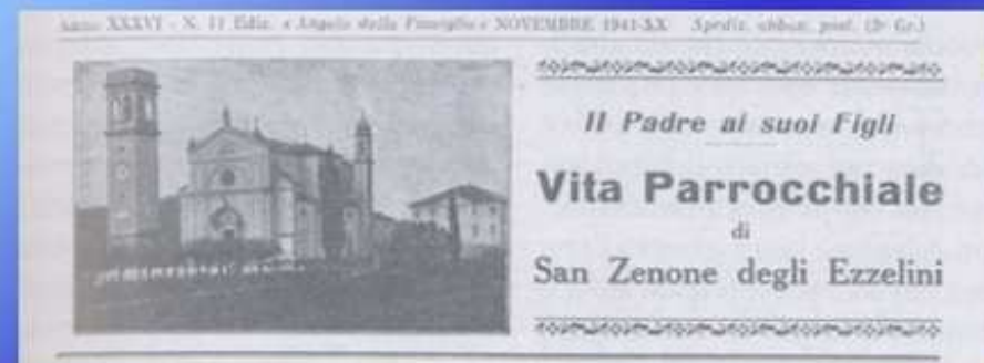
Raggiunge tutte le famiglie attraverso la pubblicazione mensile Vita Parrocchiale di San Zenone degli Ezzelini