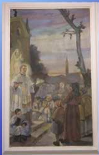
Don Giuseppe Sarto, il catechismo e la predicazione mariana