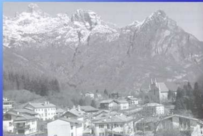
Colonia montana a Sospirolo (Belluno, 1950) ...