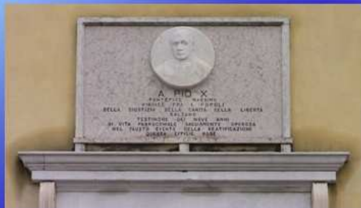
Bassorilievo del Beato Pio X, scolpito dagli artisti della "Lavorazione artistica del marmo Alberto Bersanti" di Pietrasanta (Carrara)