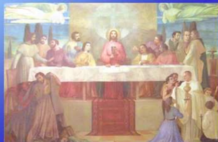
Ultima cena (A. Monzio Compagnoni 1954)