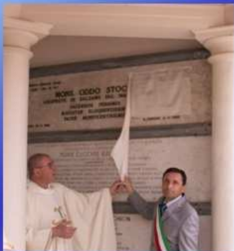
E' riconosciuto "Giusto tra le nazioni" (2010)