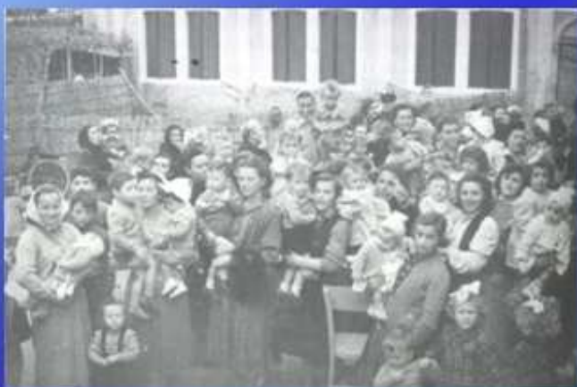
... con le donne e le mamme di famiglia (1954)