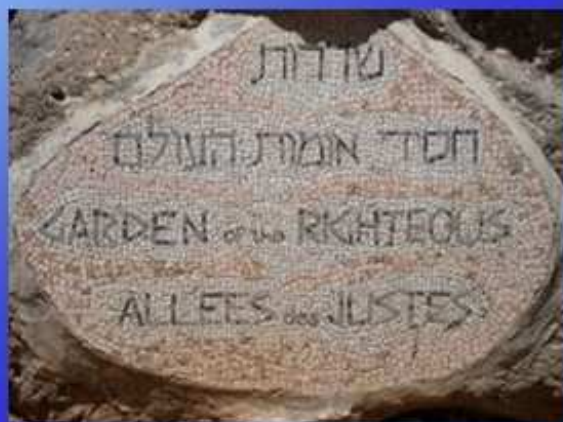
E' riconosciuto "Giusto tra le nazioni" (2010)