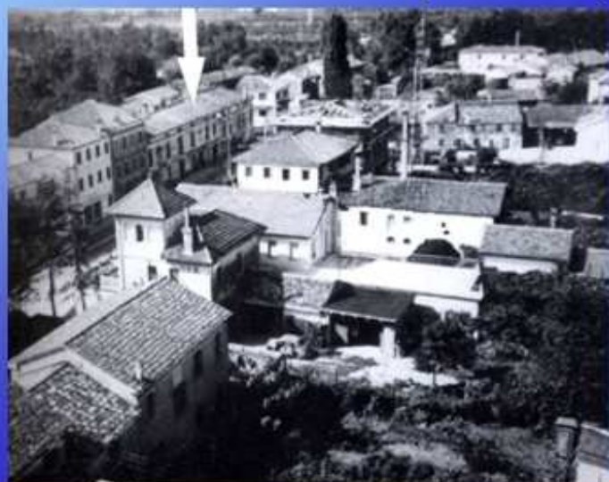
La casa natale