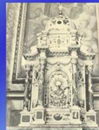
Il tabernacolo di don Giuseppe Sarto